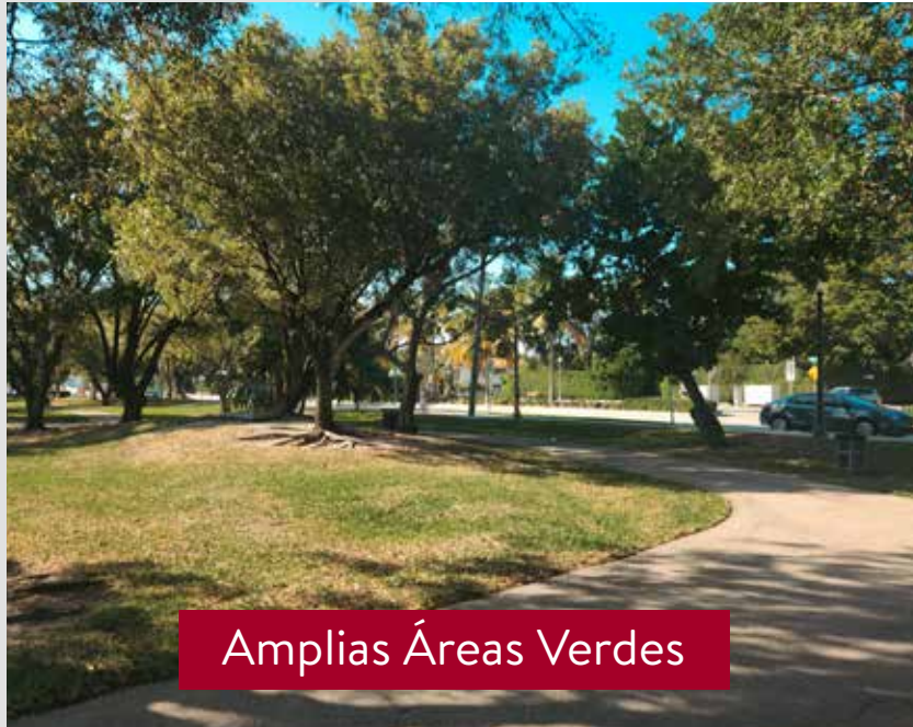
Amplias Áreas Verdes