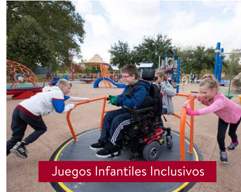
Juegos Infantiles Inclusivos